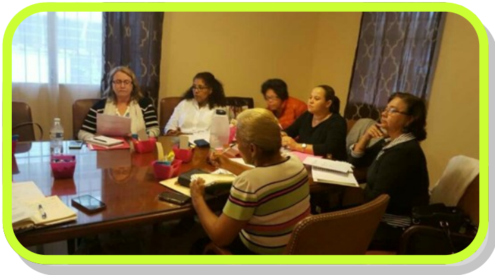
Primera Reunión de la Junta Directiva a Nivel Nacional y Taller con el Tema: Principios de Liderazgo en nuestros ministerios