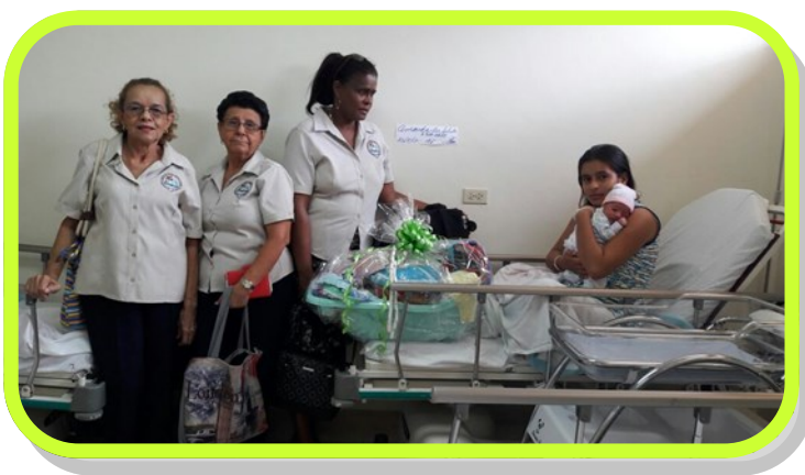
Informó la Presidenta Yahaira Ruiz

En celebración al mes del Metodismo el Distrito de Panamá realiza visita a Área Hospitalaria y comparten con mujeres canastillas, para cumplir el llamado a servir y llevar esperanza a quienes lo necesitan.