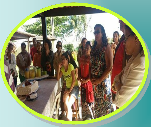
En reunión Plena