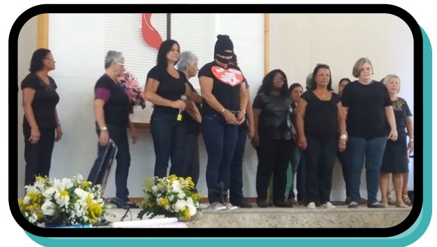
Mujeres del distrito de São Gonçalo haciendo la propaganda de Jueves de Negro.