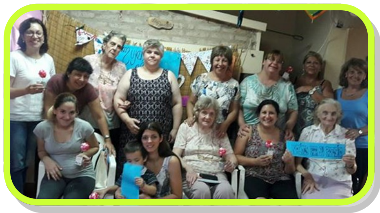
Encuentro de Mujeres FeMMA Pastoral de la Mujer .Colón, Entre Ríos.