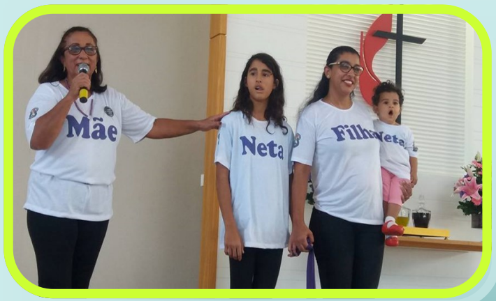
Tres generaciones haciendo la propaganda de la SMM,